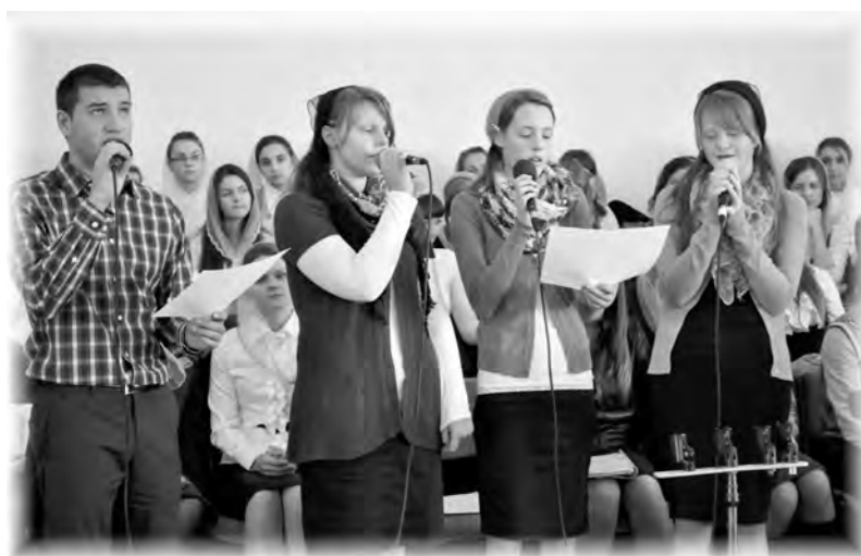
Гости из Германии