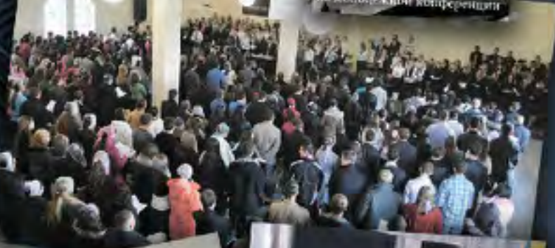
Молодежная конференция, г. Рыбинск