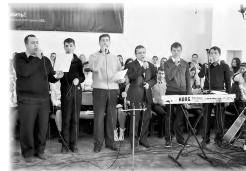
Группа «Soli Deo Gloria», г.Кишинёв