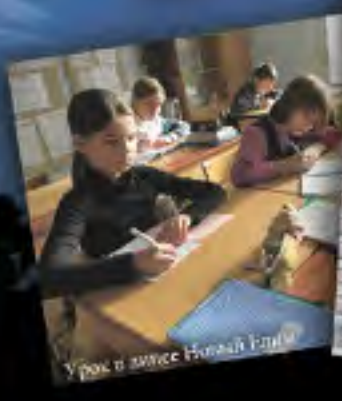
Урок в классе Новой Елены