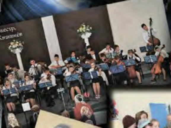
Оркестр г. Клязьма