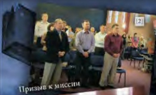
Призыв к миссии