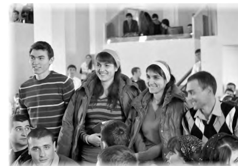
Представление делегатов конференции