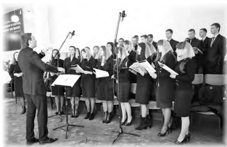
Гости конференции- хор г.Винница

Шестая региональная конференция молодежи ХВЕ прошла 29 октября в Рыбнице. Более 500 человек из разных регионов страны стали участниками приднестровского служения.