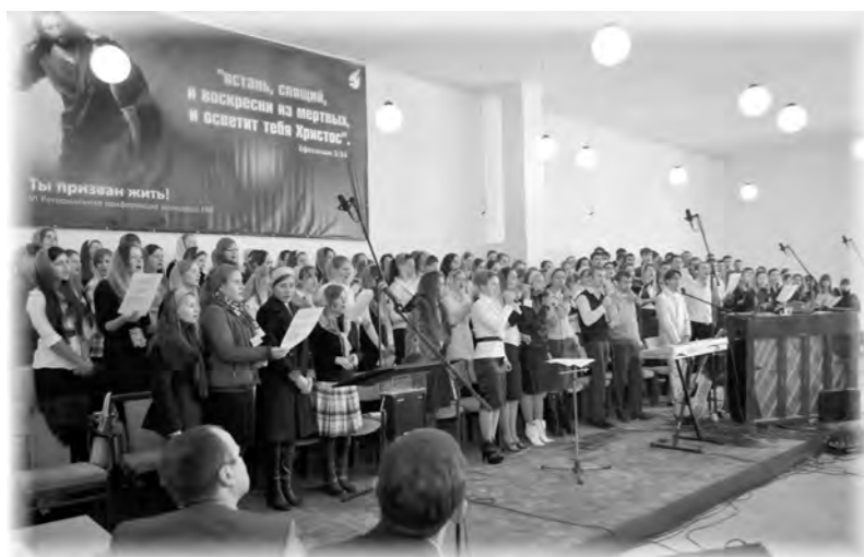
Молодёжный сводный хор