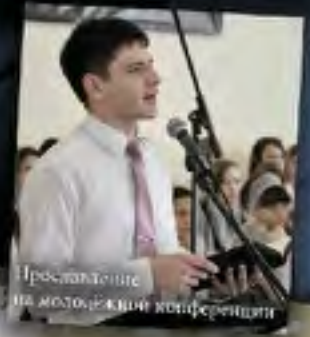
Презентация на молодежной конференции