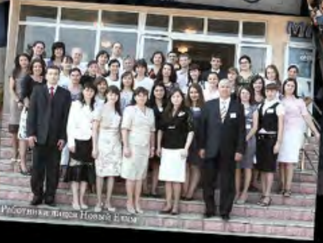
Работники завода Новой Елены